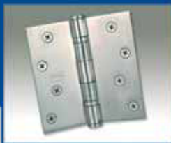
Bisagras de acero inoxidable con rodamientos