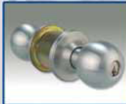
Cerradura de perilla